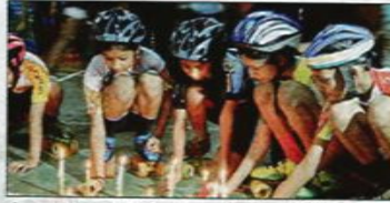
ಕೈಗಾದ ರೋಲರ್ ಸ್ಕೇಟಿಂಗ್ ಆಕಾಡೆಮಿಯ ಮಕ್ಕಳು ಮೇಣದಬತ್ತಿ ಬೆಳಗಿಸಿ ಶ್ರದ್ಧಾಂಜಲಿ ಕೊಂಡಿದರು.

ಕಡ್ಡಾಯವಾಗಿ ಮಲ್ಟಿಪಲ್ ಕೈಗಾ ರೋಲರ್ ಸ್ಕೇಟಿಂಗ್ ಆಕಾಡೆಮಿಯ ವತಿಯಿಂದ ಸತತ 8 ಗಂಟೆ ಸ್ಕೇಟಿಂಗ್ ಮಾಡುವ ಮೂಲಕ ಉತ್ತರಾಖಂಡದ ಪ್ರವಾಹದಲ್ಲಿ ಮಡಿದವರಿಗೆ ಶ್ರದ್ಧಾಂಜಲಿ ಸಲ್ಲಿಸಲಾಯಿತು. ಸ್ಕೇಟಿಂಗ್ ಗಾಲಿ ಶೇಖರಿಸುವುದು 150 ಮೂಲಕರು ಮತ್ತು ವಾಲಕಿಯರು ಈ ಪ್ರದರ್ಶನದಲ್ಲಿ ಭಾಗವಹಿಸಿದ್ದರು. ಉತ್ತರಾಖಂಡದ ಸ್ಥಳೀಯ ಆದರಲ್ಲಿ ಮೇಣದ ಬತ್ತಿ ಹೆಚ್ಚು ಎರಡು ನಿಮಿಷ ಮೌನಾಚರಣೆ ಮಾಡುವ ಮೂಲಕ ಸ್ಕೇಟಿಂಗ್ ಪ್ರಾರಂಭಿಸಲಾಯಿತು. ಕಾರ್ಯಕ್ರಮ ಉದ್ಘಾಟಿಸಿದ ಕೈಗಾದ ಸ್ಥಳ ನಿರ್ದೇಶಕ ಎಚ್. ಎನ್. ಭಟ್ ಮಾತನಾಡಿ, 'ಈ ಸಂಕಷ್ಟದ ಪರಿಷ್ಕಾರದಲ್ಲಿ ನೆರವು ತಮ್ಮ ಒಂದು ದಿನದ