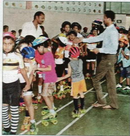
ಉತ್ತರಾಖಂಡದ ಪ್ರವಾಹದಲ್ಲಿ ಮಡಿದವರಿಗಾಗಿ ಕೈಗಾದ ಸುಮಾರು 150 ಕ್ಕೂ ಅಧಿಕ ಮಕ್ಕಳು ಸತತ 8 ಗಂಟೆ ಸ್ಕೇಟಿಂಗ್ ಏಜೆಂಟಿ ಶ್ರದ್ಧಾಂಜಲಿ ಸಲ್ಲಿಸಿದರು.

ಕಾರವಾರ: ಕೈಗಾ ರೋಲರ್ ಸ್ಕೇಟಿಂಗ್ ಆಕಾಡೆಮಿ ಸತತ 8 ಗಂಟೆಗಳ ಕಾಲ ಸ್ಕೇಟಿಂಗ್ ಪ್ರದರ್ಶನ, ಉತ್ತರಾಖಂಡದಲ್ಲಿ ಮೃತಪಟ್ಟವರಿಗಾಗಿ ಆಶ್ರುತರ್ಪಣ ಸಲ್ಲಿಸಿತು.