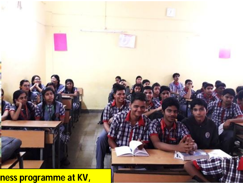
Nuclear Energy Awareness programme at KV, Bhandup on 2.2.2017