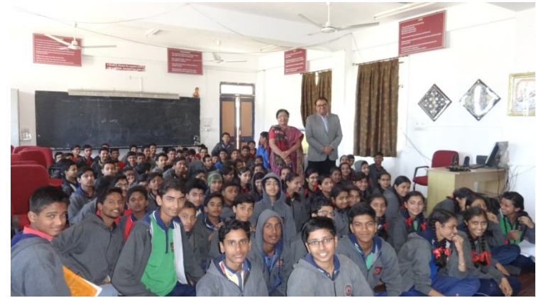
Nuclear Energy Awareness programme at KV, BSF, Indore on 27.1.2017