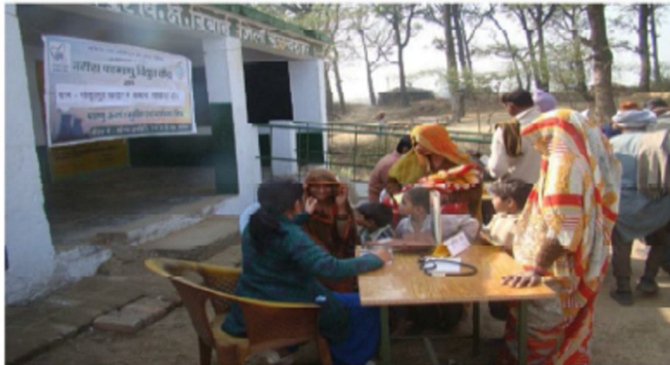
ग्रामीण महिलाओं की जाँच करती हुई महिला चिकित्सा अधिकारी