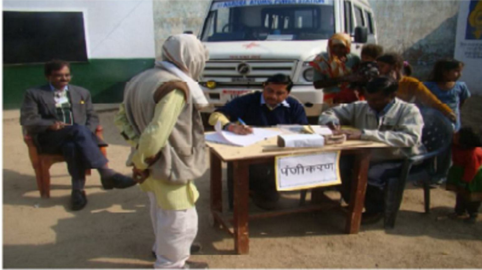
रोगियों का पंजीकरण