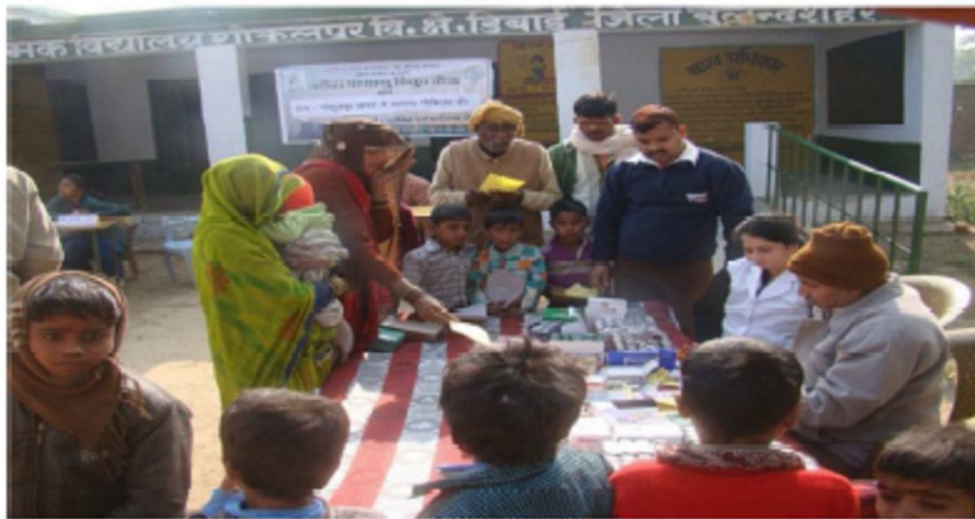
निशुल्क दवा वितरण