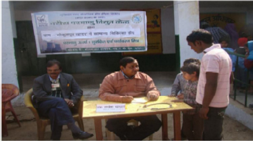
मरीजों की जाँच करते हुए चिकित्सा अधिकारी

नरोरा परमाणु विद्युत केन्द्र द्वारा ग्राम-गोकुलपुर खादर, थाना-रामघाट में दिनांक 24.01.2013 को आयोजित निशुल्क चिकित्सा शिविर के कुछ चित्र