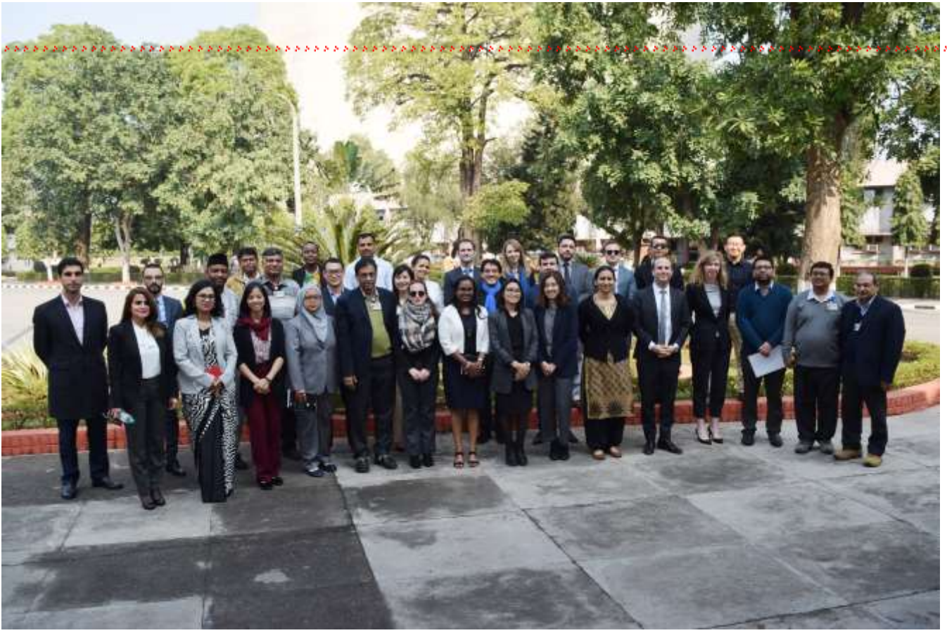
विदेशी एवं भारतीय पर्यटकों का प्लांट भ्रमण