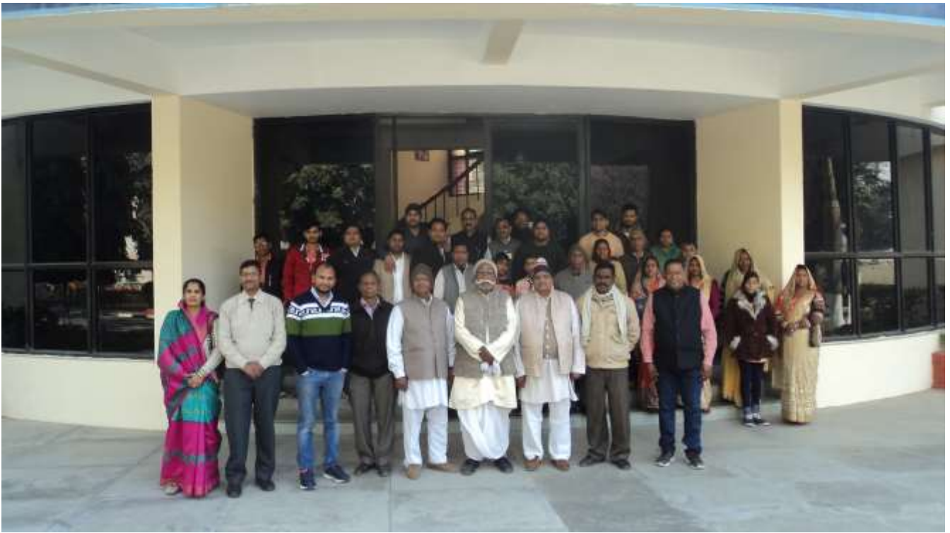
सेवानिवृत्त कर्मचारियों के परिवारजनों का प्लांट भ्रमण