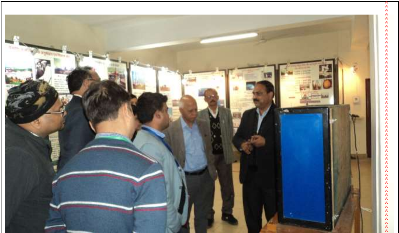
डीआइओएस, कासगंज एवं परिवारजनो का प्लांट भ्रमण