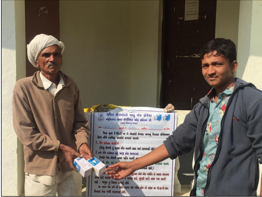
नवागाम (नाना) गाँव के सरपंच द्वारा बल्ब का वितरण। Distribution of bulb by Sarpanch of Navagam (Nana) Village.