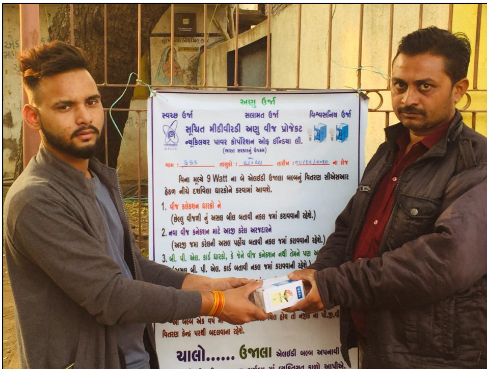
कुकड गाँव के सरपंच द्वारा बल्ब का वितरण। Distribution of bulb by Sarpanch of Kukad Village.