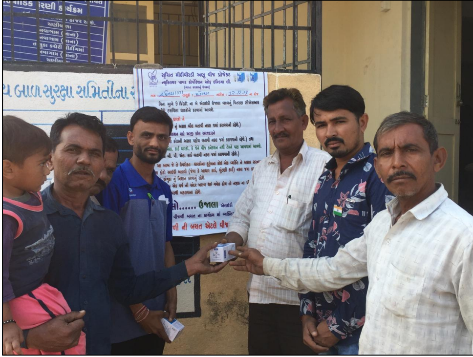
चणियाला गाँव में बल्ब का वितरण। Distribution of bulb in Chaniyala Village.