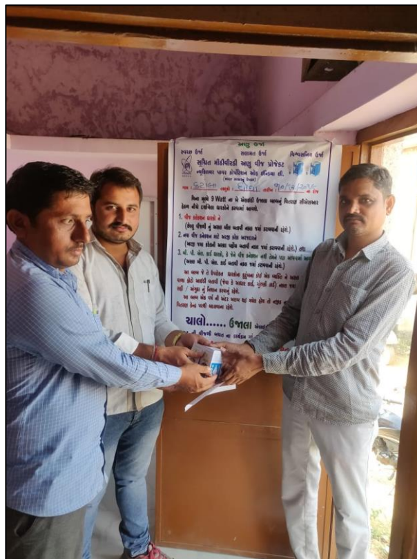
कंटाला गाँव के सरपंच द्वारा बल्ब का वितरण। Distribution of bulb by Sarpanch of Kantala Village..