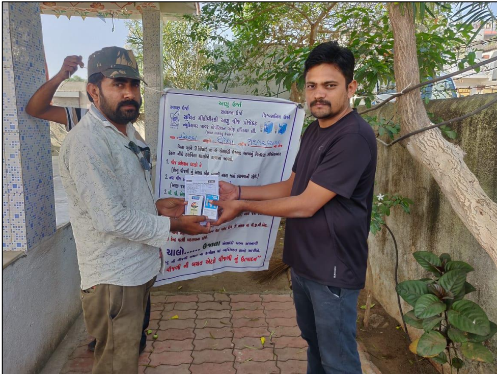
ओदरका गाँव के सरपंच द्वारा बल्ब का वितरण। Distribution of bulb by Sarpanch of Odarka Village..