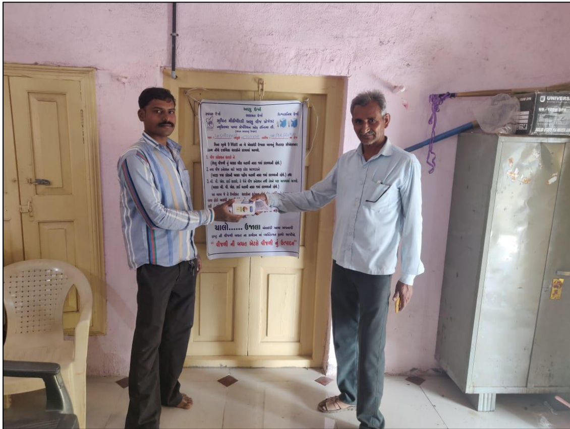
पाणियाली गाँव के सरपंच द्वारा बल्ब का वितरण। Distribution of bulb by Sarpanch Paniyali Village.