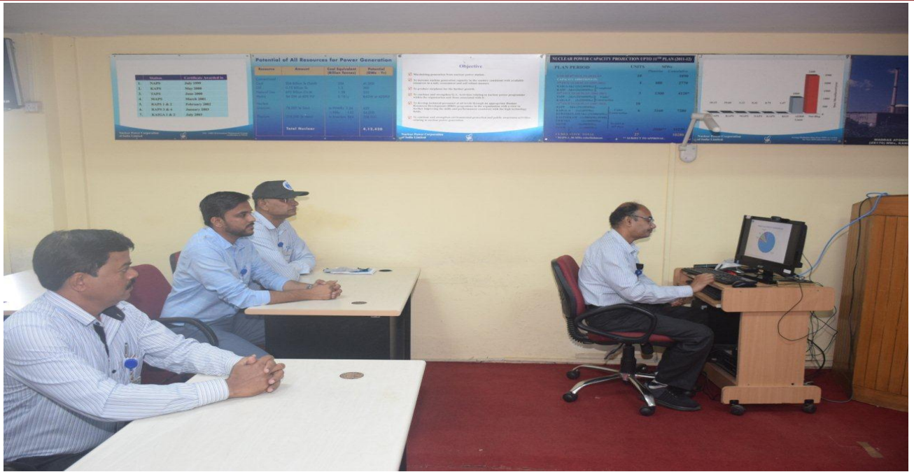
"Faculty presenting the webinar"