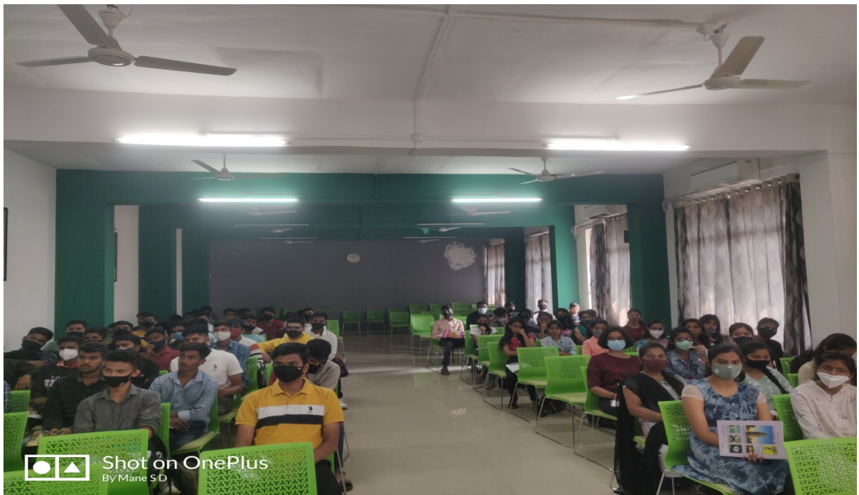
"Students getting benefit of Webinar"