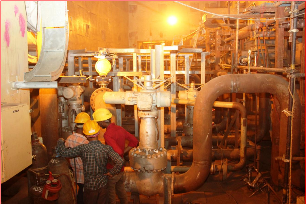
Unit#3 PHT Circuit piping work